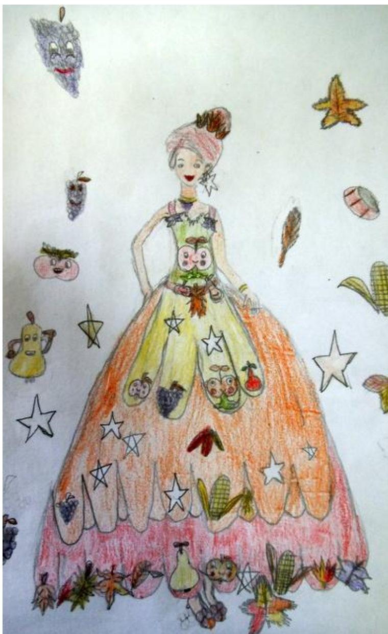
Рад Јоване Косанић III 3 на тему Краљица јесени

Планирају се нове активности и сарадња школе и родитеља за новембар и децембар.