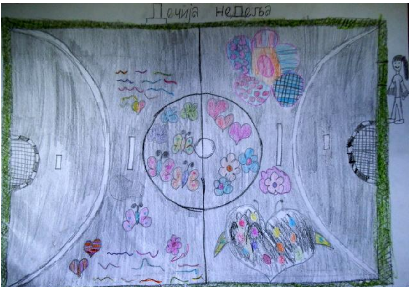
Рад Јоване Косанић III 3 - Како је изгледао терен првог дана кад су деца цртала породицу