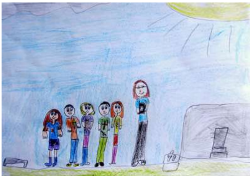
Нађа Ђоковић II 3

Највреднији су били ученици млађих разреда и њихови радови су у Чаролијама 28.